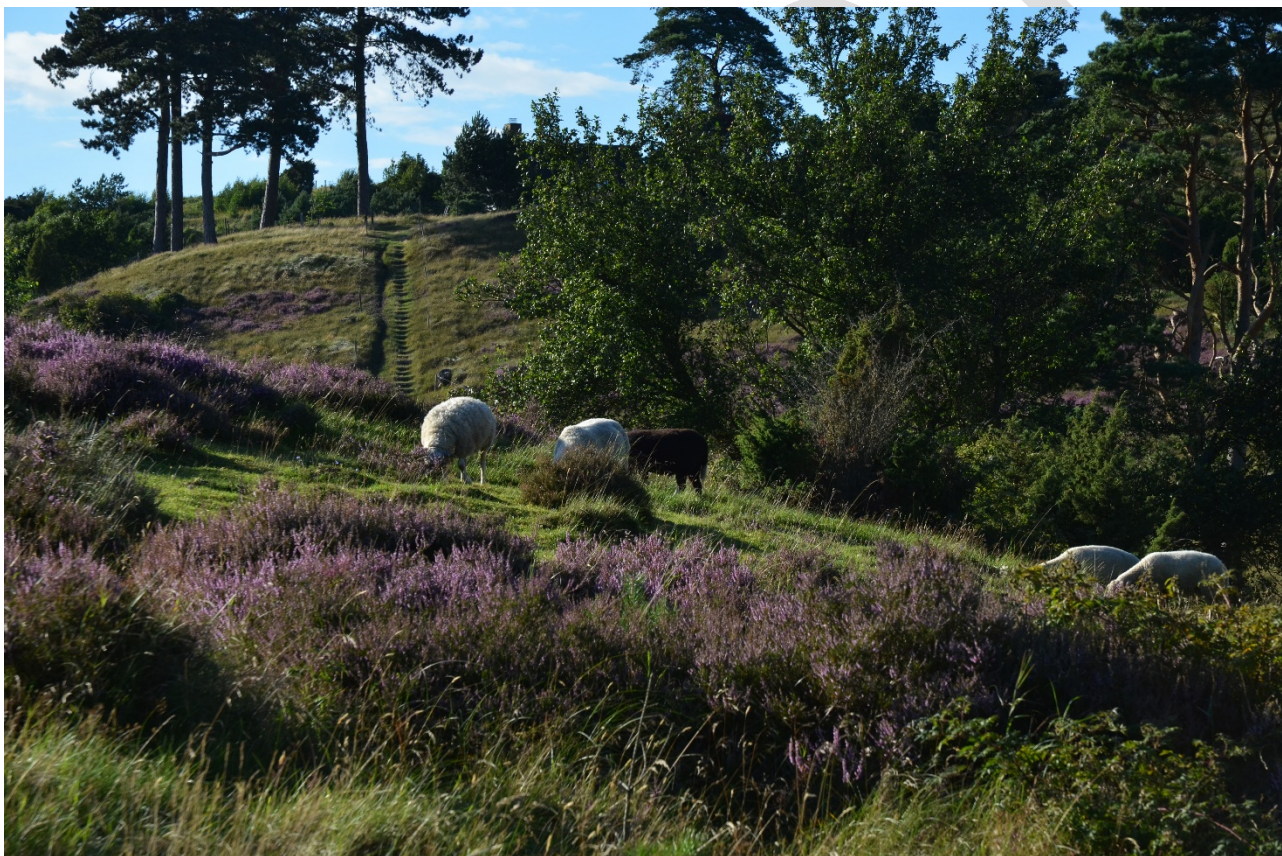
Fåregræsning på klithede i Tibirke Bakker. Fotograf: Carsten O. Hansen (år 2017).

Effekten af indsatserne bliver løbende vurderet i det Nationale Overvågningsprogram for Vandmiljø og Natur (NOVANA), som overvåger vandmiljøets og naturens tilstand inden for de områder, der prioriteres i forhold til de politisk fastsatte økonomiske rammer.